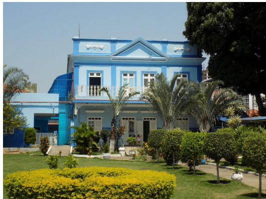
FOTO DO IMÓVEL