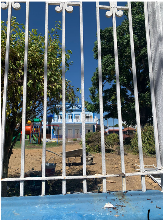
Imagem2-Colégio Batista 2023 (Atualmente)