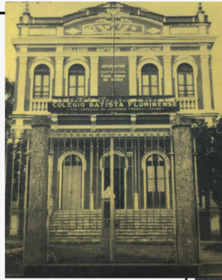
EM CAMPOS, 1914