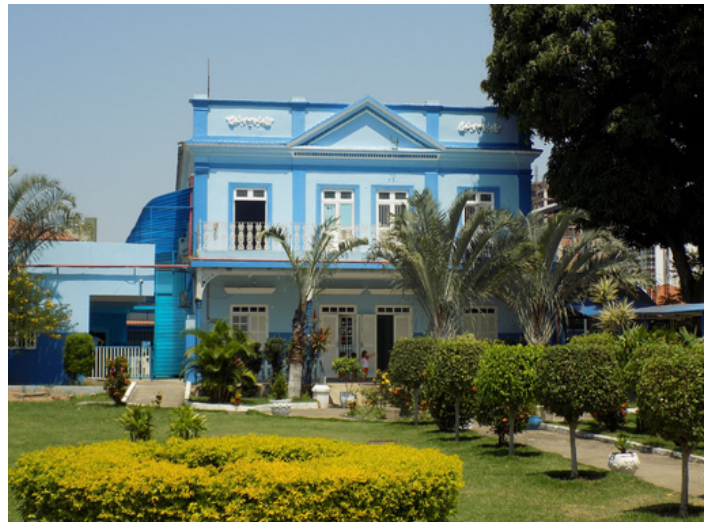
Imagem 3-Colégio Batista )